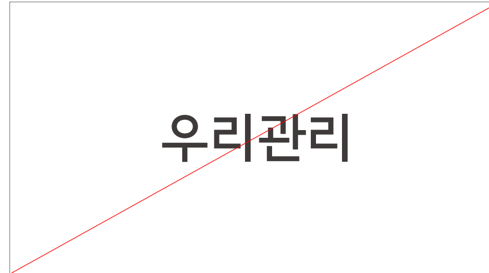
DO NOT 로고타이프 단독 사용

로고는 시각적 일관성 유지를 위해 임의로 변경해서는 안 되며, 반드시 규정된 형태와 색상을 사용해야 합니다. 예시된 내용은 사용 금지 사항입니다.