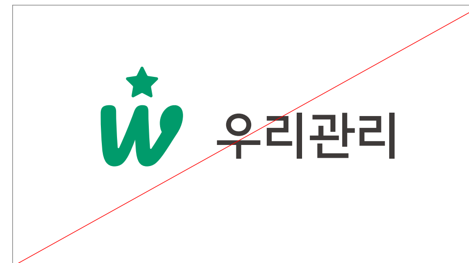
DO NOT 다른 그래픽 요소 추가 및 형태 변형